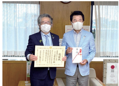
60周年記念事業の一環として栃木県と宇都宮市に20万円ずつ、寄付を行いました。