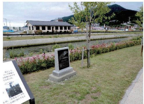
大船渡市の桜植樹祭の記念碑完成